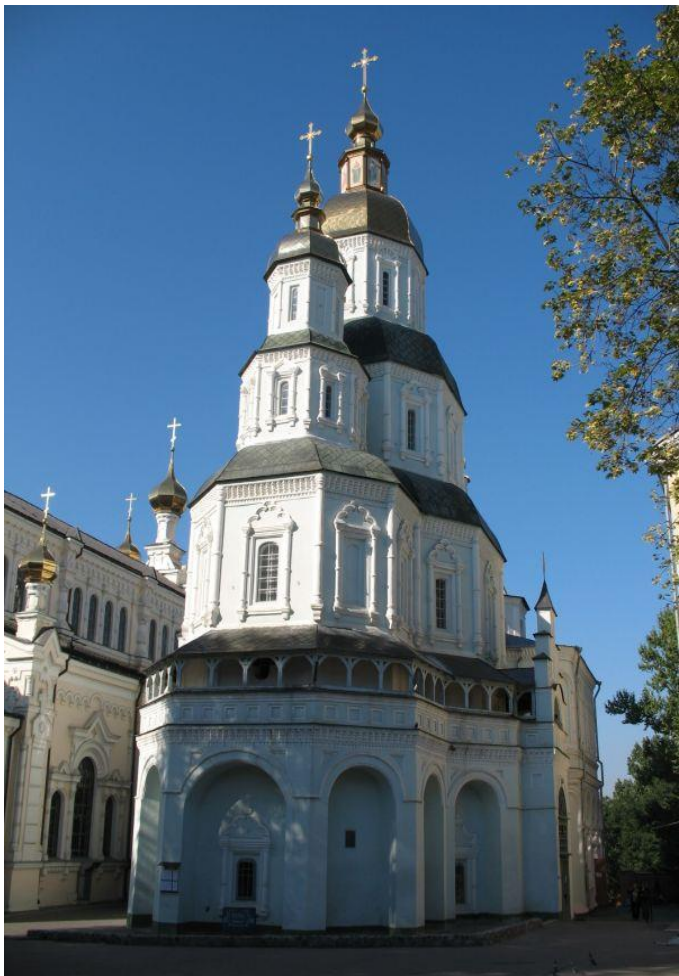
Покровський собор у Харкові. 1689 р.