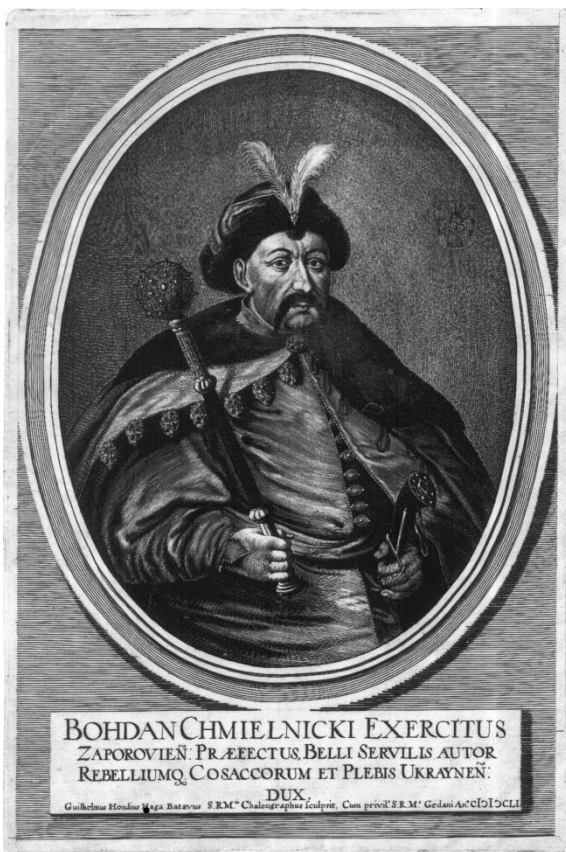
Портрет Богдана Хмельницького В. Гондіуса. Середина 17 ст.