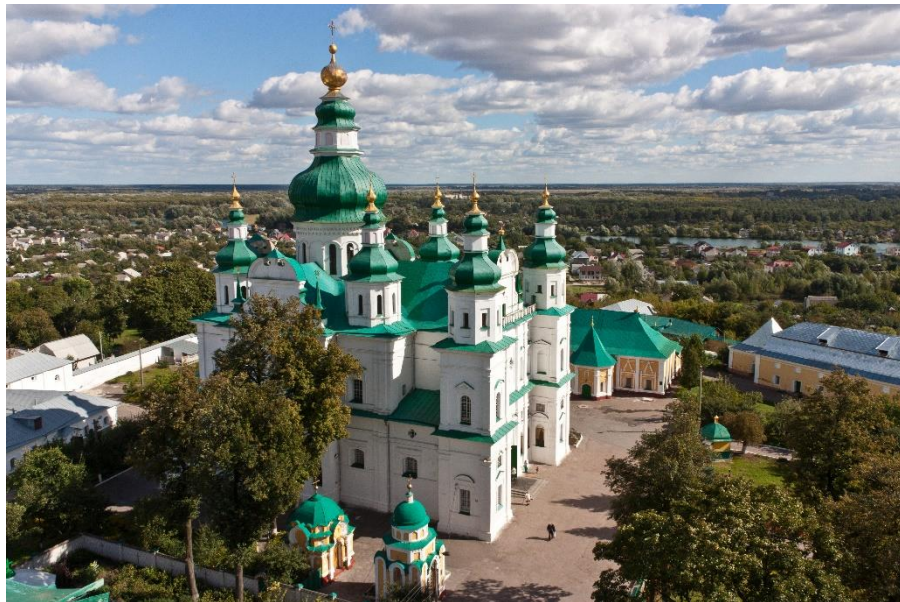
Троїцький собор Троїцько-Іллінського монастиря в Чернігові