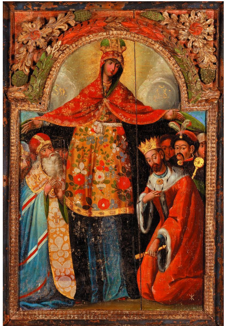
Ікона "Покров Богородиці" (з портретом Б. Хмельницького)