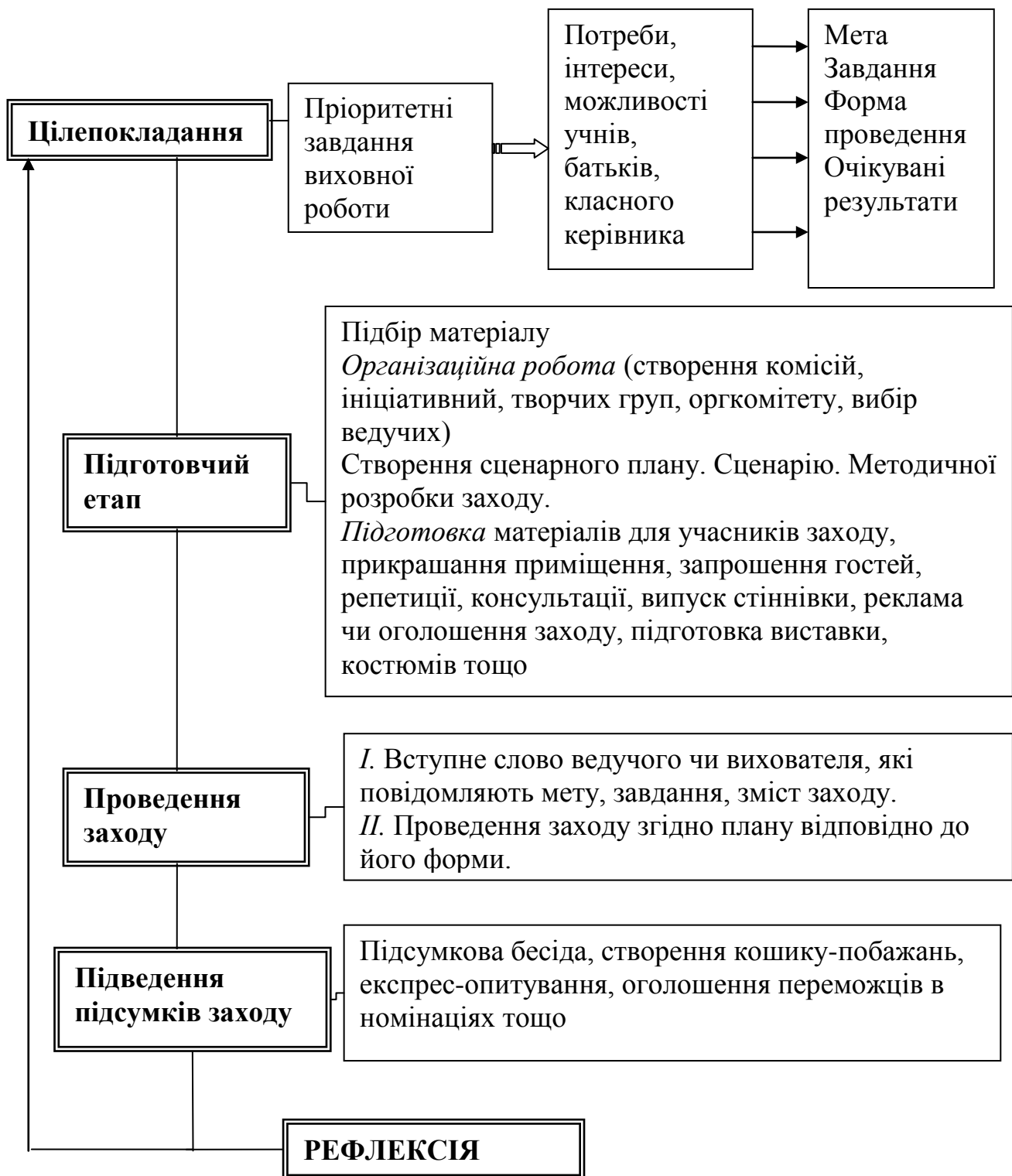
Рис. 2. Схема підготовки та проведення виховного заходу

Вміла організація учнівських зборів, є могутнім фактором зміцнення учнівського колективу і важливим засобом виховання в учнів високих моральних якостей: почуття гідності й обов'язку, сміливості і мужності, принциповості і відповідальності за свої вчинки, вміння самостійно розбиратися в питаннях, підпорядкувати особистісні інтереси суспільним, казати правду у вічі і вислухати