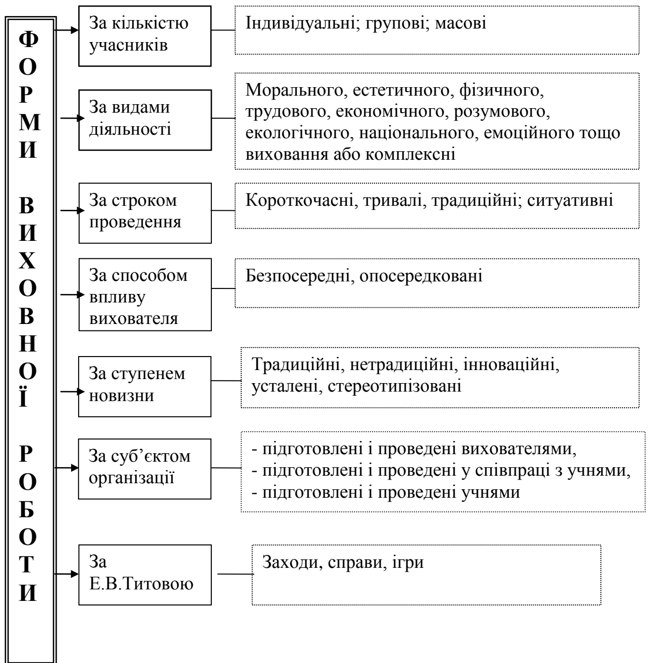
Рис. 1. Класифікація форм виховної роботи

Як бачимо, запропонована Е.В.Титовою класифікація, відображає, по-перше, ступень активності вихованців у підготовці, організації та проведенні тої чи іншої форми виховної роботи, а по-друге, дозволяє виокремити різні цілі такої діяльності.