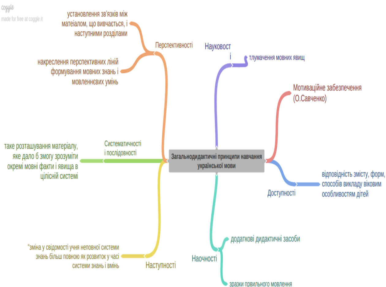
Рис.1. Загальнодидактичні принципи

Проблемне питання до студентів: розгляньте карти знань Рис.1 та Рис.2 і з'ясуйте, які принципи використовує «Методика навчання української мови»).