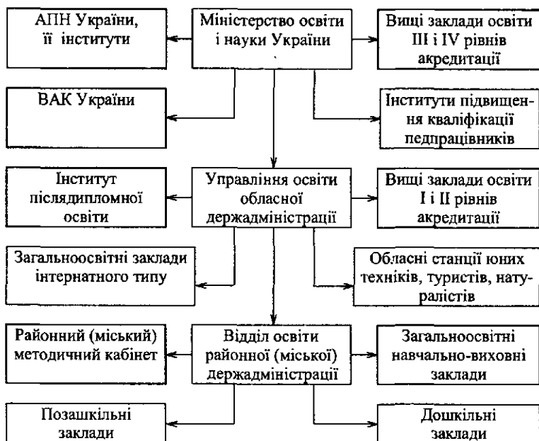
Рис 2. Структура органів управління освіти

Відповідно до Закону «Про освіту» в Україні створено таку систему органів державного управління і систему органів громадського самоврядування.