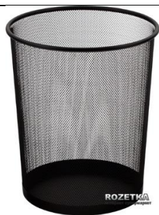
Кошик для сміття непотрібна інформація