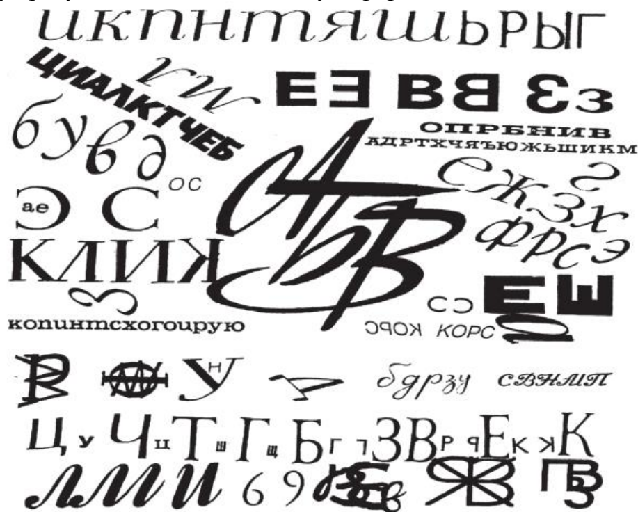
Мал. 2.45. Стимульний матеріал до тесту «Оптичне узагальнене сприйняття букв»

Психологічна структура читання включає наступні ланки: звукобуквенний аналіз і синтез; смислові припущення; утримання інформації; розуміння; процес контролю або звірення. Для протікання процесу читання необхідна наявність мотивів, потреб і відповідної організації поведінки. Сенсомоторний рівень читання забезпечує техніку читання, до якої відносяться швидкість сприйняття, точність. Семантичний рівень читання забезпечує розуміння значення і сенсу інформації