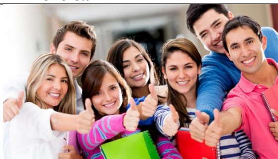
Інформація, знання, вміння і навички, які я можу використовувати зараз