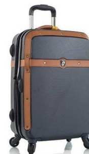
Валіза знання, вміння та навички, які