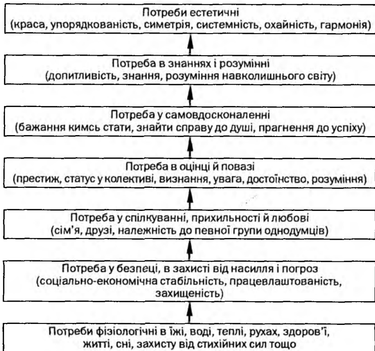
Рис. 2.1. Ієрархічна система потреб людини

2. Формування почуттів (стійких емоційних відношень людини до явищ дійсності). Вони сприяють трансформації певних дій особистості із сфери розумового сприймання у сферу емоційних переживань, що робить їх стійкими, та активізації психічних процесів людини.