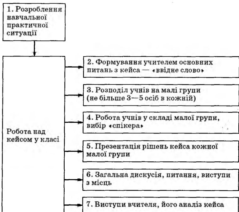
Рис. 3.3. Послідовність дій навчання CASE

Послідовність дій навчання CASE відображено на рис. 3.3.