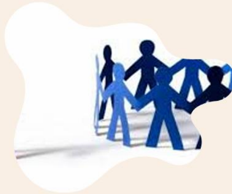
Недискримінаційне ставлення у медіа

.Загрози продукування медіареальності. Кейси «Момо», «Синій кит». Теорії змов. Постправда. Культура скасування. Хейт, хайп як види маніпуляцій у медіа.