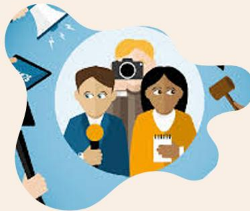
Створення та поширення масмедійного контенту

Терміносистема медіапростору. Медіа, масмедіа, соціальні медіа. Тенденції розвитку медіагалузі. ШІ як інструмент творення