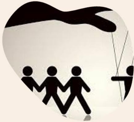
Маніпуляції в медіа

.Загрози продукування медіареальності. Кейси «Момо», «Синій кит». Теорії змов. Постправда. Культура скасування. Хейт, хайп як види маніпуляцій у медіа.