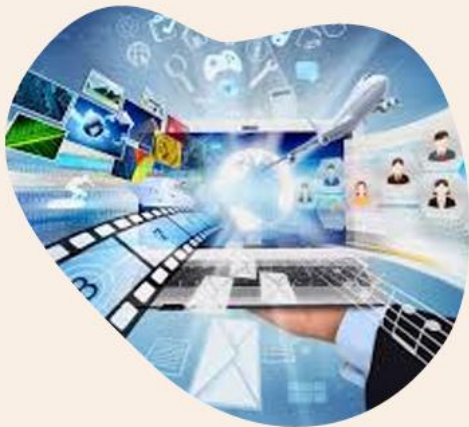
Медіапростір та медіаконтент

Терміносистема медіапростору. Медіа, масмедіа, соціальні медіа. Тенденції розвитку медіагалузі. ШІ як інструмент творення