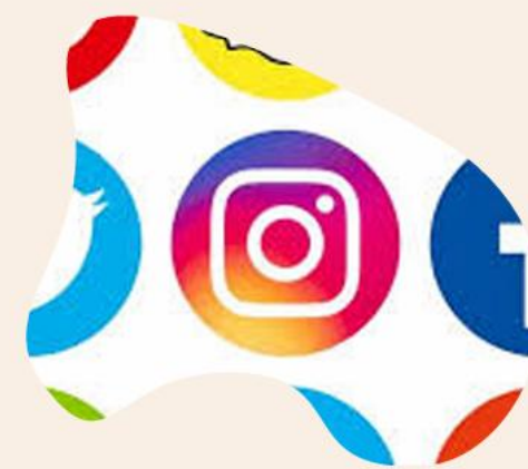
Контент соціальних медіа

Професійні стандарти журналістики. Новинний контент. Види журналістського контенту