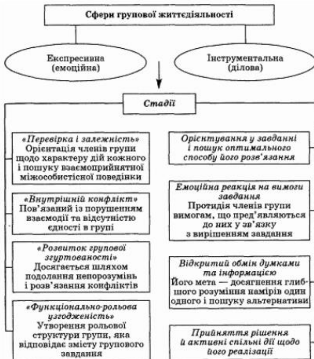
Рис. 3.1. Двовимірна модель розвитку групи (за Б. Такменом)

Обидві сфери групового розвитку, хоч і впливають одна на одну, наділені своїми внутрішніми особливостями та закономірностями. У кожній сфері існує по чотири стадії, які послідовно змінюють одна одну.