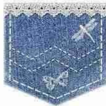
Автономія школи і якість освіти