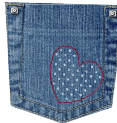
Орієнтація на учня