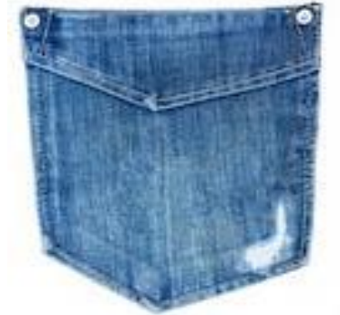
Сучасне освітнє середовище