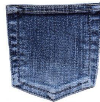
Справедливе фінансування і рівний доступ