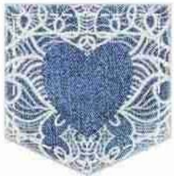
Виховання на цінностях