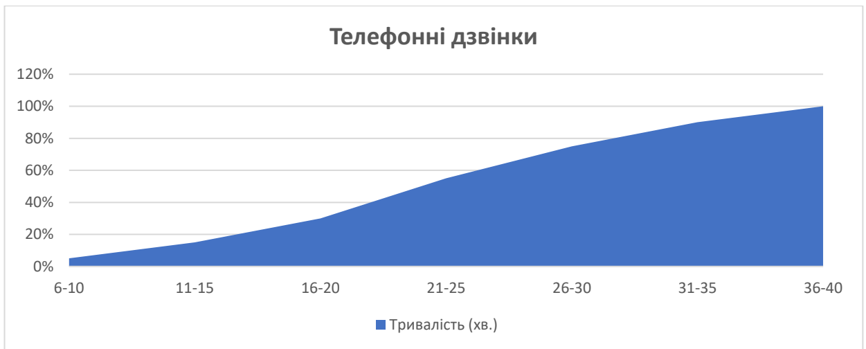
Малюнок 1–5. Кумулята частот для телефонних дзвінків