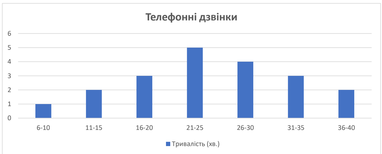
Малюнок 1–2. Гістограма частот для телефонних дзвінків

Побудуємо гістограму частот для прикладу з телефонними дзвінками. Використовуємо для цього результати, отримані нами в таблиці 2–6 розподілу частот. По осі X відкладаємо відповідні інтервали: 6–10, 11–15 і т.д., разом сім. В інтервалі 6–10 будуємо прямокутник висотою 1, що означає, що лише один дзвінок з 20 потрапив за тривалістю в перший інтервал, в другому інтервалі – прямокутник висотою 2 і так далі. Гістограма частот корисна для візуальної оцінки даних. Можна відзначити, що найбільш популярний час: 21–25 хвилин, в цей інтервал потрапило 5 дзвінків, це більше, ніж в будь-якому іншому інтервалі.