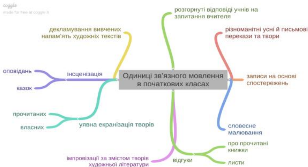
Рис 1. Одиниці зв'язного мовлення

(Завдання для студентів. Розгляньте Рис.1 і з'ясуйте, які одиниці зв'язного мовлення в початкових класах.)